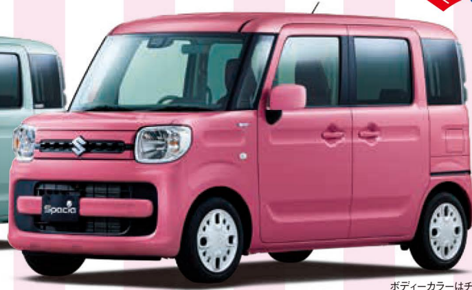
Photo : HYBRID G ボディカラーはチアフルピンクメタリック