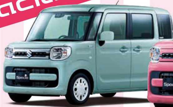
Photo : HYBRID X ボディカラーはオフブルーメタリック